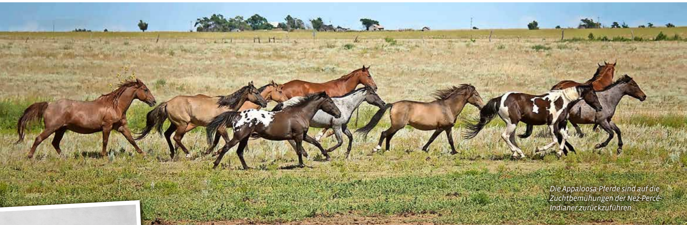
Die Appaloosa-Pferde sind auf die Zuchtbemühungen der Nez-Perce-Indianer zurückzuführen.