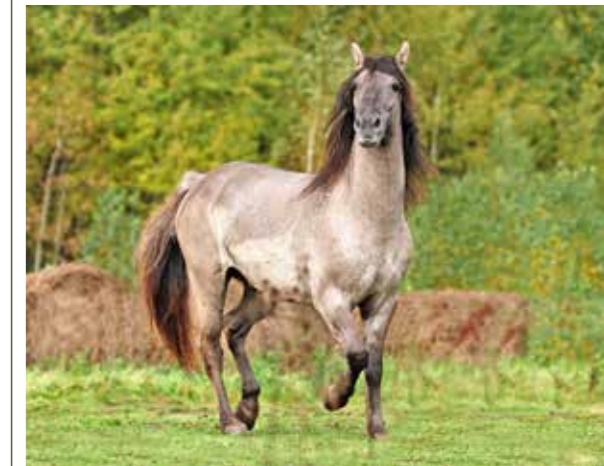
Das russische Baschkire-Pferd eignet sich für Reiter, Landwirte und Milchtrinker.

Der Baschkire ist mit einem Stockmass von 132 bis 152 Zentimetern ein kleines Pferd. Seine Vorzüge sind dafür umso grösser. Denn die russische Rasse ist nicht nur überaus widerstandsfähig und damit bestens als Last- und Zugtier geeignet, sondern auch für seine hohe Milchleistung von bis zu 2700 Litern in der acht- bis neunmonatigen Laktationsperiode bekannt. Dies schätzen viele Bewohner der russischen Steppe. Sie lassen die Stutenmilch zum sogenannten Kumys vergären und konsumieren das Getränk regelmässig, weil sie ihm besondere Heilkräfte zusprechen.